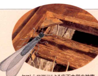
ヤマトシロアリによる床下木部の被害