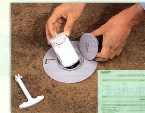
セントリコン ® ・システム モニタリングレポート

根絶後も、新たなシロアリの侵入がないかを定期的に監視し、兆候があればすぐに必要なサービスを実施。大切なお住まいをシロアリから守り続けます。