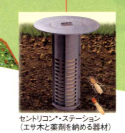
セントリコン ® ・ステーション (エサ木と薬剤を納める器材)